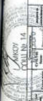
Таблица учета расходов на образование на 1 сентября 2022 года